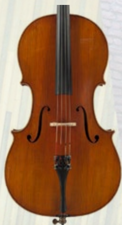
Cello gebouwd door Marino Capicchioni, 1964

Met ruim 500 instrumenten en 250 strijkstokken is de collectie van het NMF een van de grootste collecties muziekinstrumenten in Europa. Strijkinstrumenten vormen de kern en daaromheen cirkelen vele vleugels, fortepiano's, harpen en klassieke gitaren. Verder beschikt het NMF over een basklarinet, contrabasklarinet, contrabasfluit en marimba. De twee bijzondere strijkstokkencollecties (barok en klassiek) kunnen op tijdelijke basis gebruikt worden voor projecten.