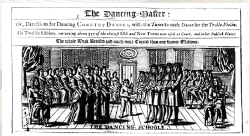
‘Cockle-Shells’ in John Playford’s The Dancing-Master , editie 1703.

Ergens rond 2012 leerde ik een schijfje kennen met ‘English Country Dances’, gespeeld door o.a. Paul O’Dette. Eén van de vele 17e-eeuwse dansjes op deze cd vond ik bijzonder pakkend; ik vond het eigenlijk steeds te kort duren. Om die reden heb ik een uitgebreidere versie gemaakt, waarin ik mijn best heb gedaan het melodietje goed uit te mangelen. De originele melodie draagt de prozaïsche titel Cockle-Shells (‘kokkelschelpen’; het past zodoende wel goed bij het maritieme verleden van Almere) en is te vinden in de The Dancing Master van John Playford, edities 11 tot 18, rond 1700. Mijn compositie heet dus ‘Cockle-Shells XL.’”